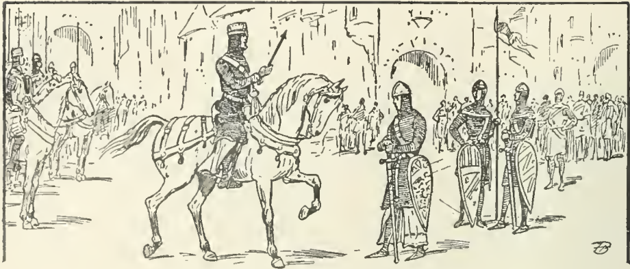
Que t'a fait ton malheureux père ? (page 324)